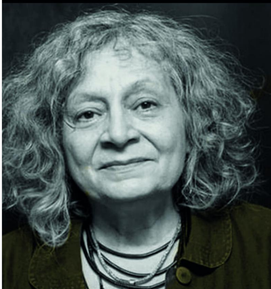
Ana Rita Segato

« La première chose que le colonialisme interne nous prend est le miroir à mémoire »